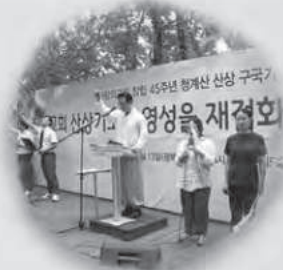
2023년 창립45주년 청계산 산상 구국기도회