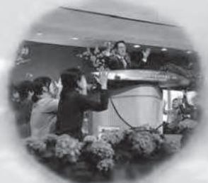
2024년 제22차 봄 글로벌 특별새벽부흥회