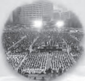
2009년 시청광장 부활절연합예배

하나님은 룯기를 통해 역전의 드라마를 보여주십니다. 우리는 인생에 마침표를 나 스스로 찍을 때가 많지만 하나님은 늘 언제나 쉼표를 찍으십니다. 우리는 돌이킬 때 새로운 전환점을 맞이하게 되며, 선택은 언제나 결과를 낳습니다. 우리는 룯처럼 좁은 길, 사랑의 길, 믿음의 길을 선택해야 합니다. 고통 중에도 전능하신 하나님의 이름을 불러야 합니다. 다시 시작할 때 은혜를 붙잡아야 합니다. 우리는 하나님의 은혜(Grace)를 받아 특별한 은총(Favor)을 누리야 합니다. 받은 은혜를 나눌 때 더욱 큰 은혜가 임합니다. 하나님께서 일하시는 쉼표에 마침표를 찍지 않는 삶이 되시길 바랍니다.