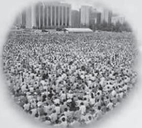
1984년 여의도광장 한국 기독교 100주년 선교대회

우리가 간절히 기도할 때 하늘 문을 여시고 주님이 예비하신 기도의 풍성한 응답을 허락하옵소서