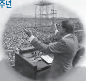
1973년 여의도광장 빌리그래함 전도대회